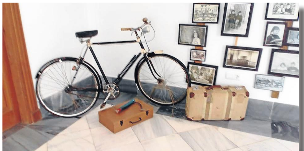
La bicicleta y maletas recordando a los maestros rurales.