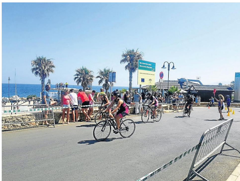
El ciclismo recorrió varios kilómetros por la pedanía villariquera.