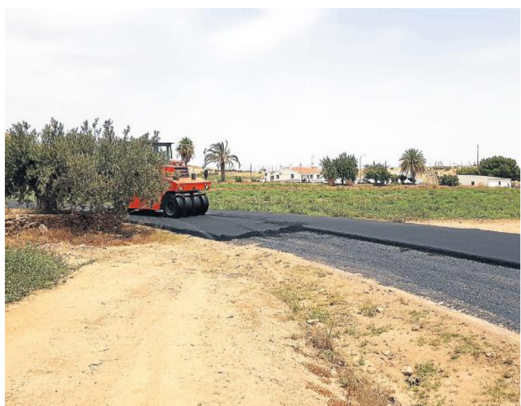
En Los Guiraos.