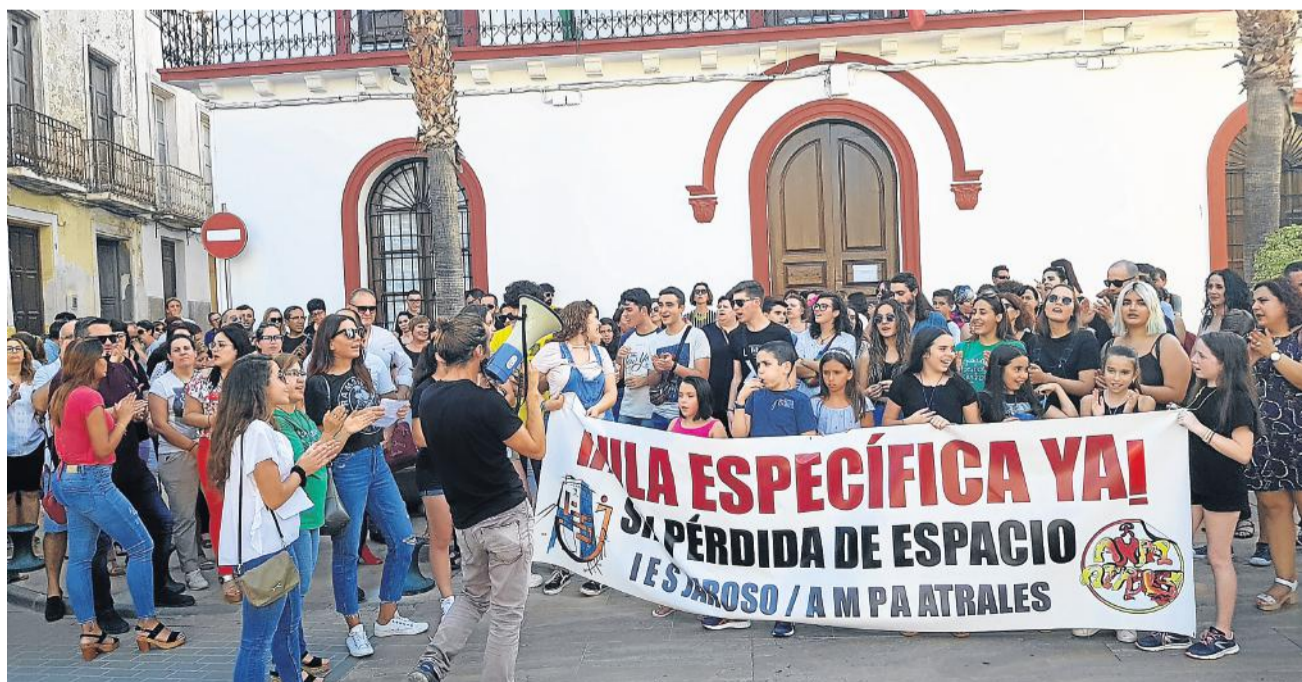
Manifestación en las puertas del Ayuntamiento cuevano.

El escrito elevado el pasado mes de marzo a la Comisión de Peticiones del Parlamento Europeo indicaba que el transporte "clandestino" de un total de 156 cajas con 1.466 kilos de material radioactivo es un "nuevo suma y sigue en una tropelía que afecta a los pilares de la economía de la zona, basada en la agricultura y en el turismo, además de a la dignidad de los vecinos".