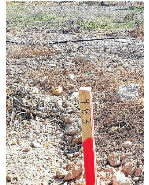
Estacas del AVE.

Miguel Cárceles.- Casi ocho años después de que el fin de obra en los tramos de plataforma del Corredor Mediterráneo entre Vera y Los Arejos (Sorbas) inaugurase el parón en las obras del principal proyecto de infraestructura pendiente a día de hoy en la provincia de Almería, los tajos empiezan a señalizarse. Miles de estacas numeradas y teñidas de color han comenzado a aparecer en los terrenos sobre los que comenzará a trazarse en cuestión de días la plataforma de la Línea de Alta Velocidad entre Murcia y Almería en el tramo que se encuentra a día de hoy más avanzado en expropiaciones, el de Pulpí-Vera. Tan avanzado que es el único en el que este tedioso, largo y garantista proceso está completamente acabado. Con la señalización se augura que en cuestión de días o semanas Fomento retomará los tajos que quedaron abandonados poco después de que en 2011 el PP accediese al Gobierno con las cuentas públicas en un serio problema de déficit financiero.