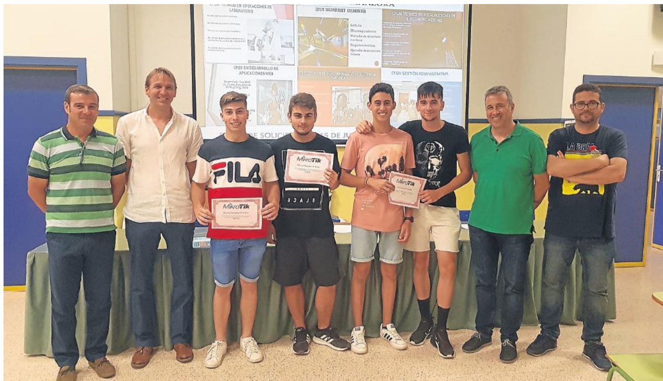
Los alumnos certificados con el MTCNA de Mikrotik junto a profesores y empresario.

Los ciclos formativos en Cuevas están trabajando muy codo a codo con el tejido empresarial del lugar.