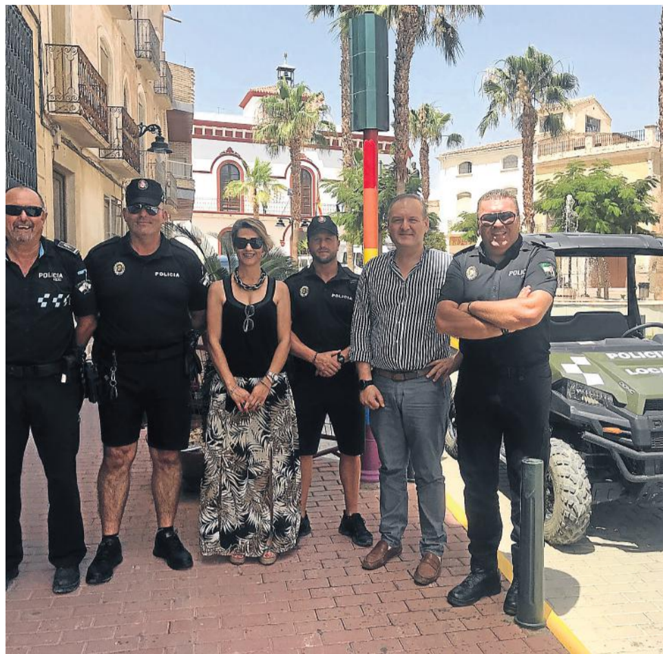
Buggie para la Policía Local y la vigilancia en las playas.

Este nuevo equipamiento se une a las mejoras que el Ayuntamiento lleva realizando al cuerpo de la Policía Local, para ampliar y reforzar el trabajo de vigilancia y seguridad que realizan cada día, como la nueva creación de una patrulla de vigilancia de playas, que usará nuevo vestuario de verano.