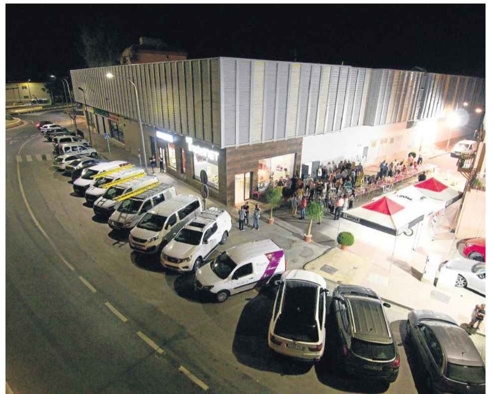
Vista desde el aire del local y la velada de la inauguración el pasado 5 de julio.

'Cuevas Magazine' ya habló con ellos hace un año y ya entonces explicaban todos los detalles de sus inicios: "empezamos