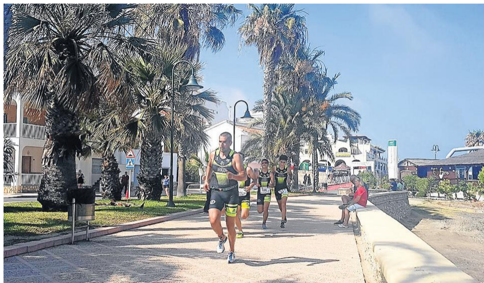
Hombres y mujeres se emplearon a fondo en la carrera por el paseo marítimo de Villaricos