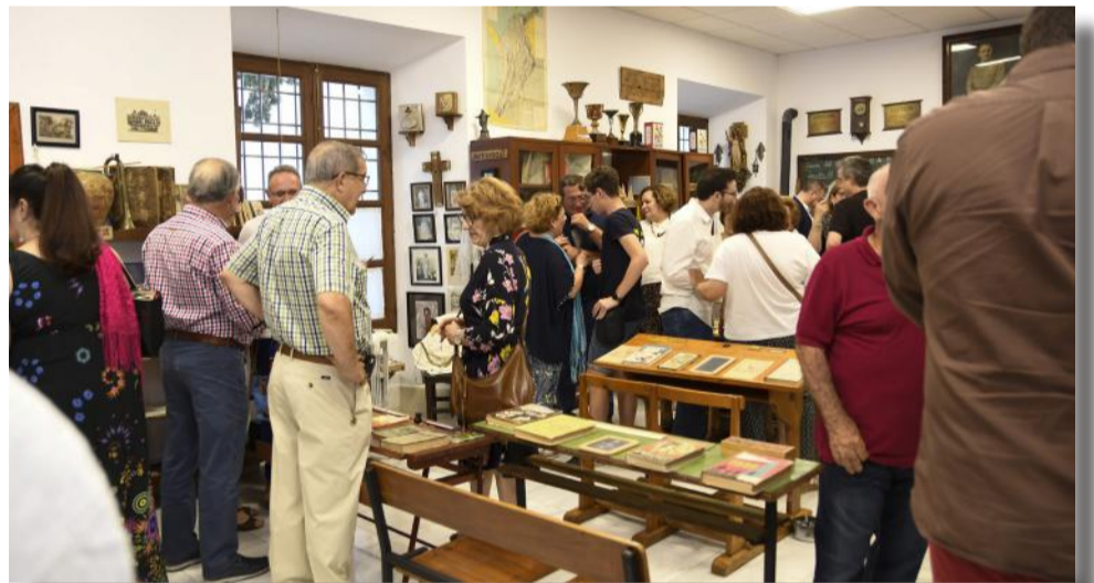
Los objetos y elementos de la época hicieron surgir los recuerdos de aquellas décadas.