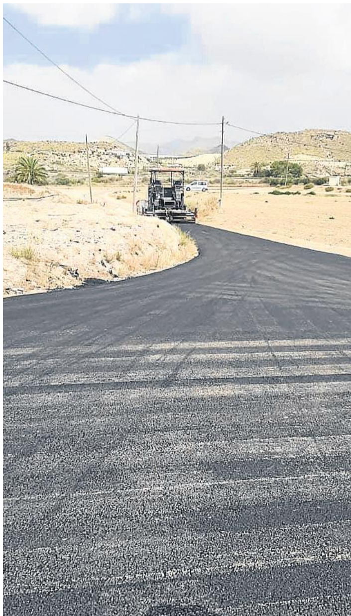
Camino de Puente Jaula en Los Lobos.