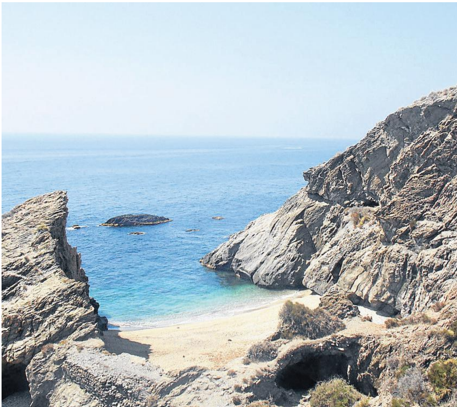
La Cala del Peñón Cortado es una de las que más llaman la atención de los visitantes.