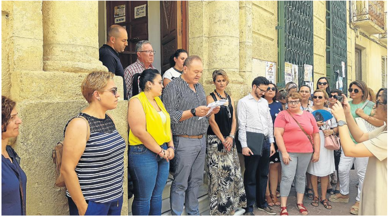
Durante la lectura del manifiesto por la Igualdad de Derechos y de Trato.

Por otro lado, se ha pintado la bandera LGTBI en los pilares de entrada del Parque del Recreo, con la finalidad de dar visibilidad al colectivo LGTBI y promover la libertad y la diversidad sexual en la sociedad.