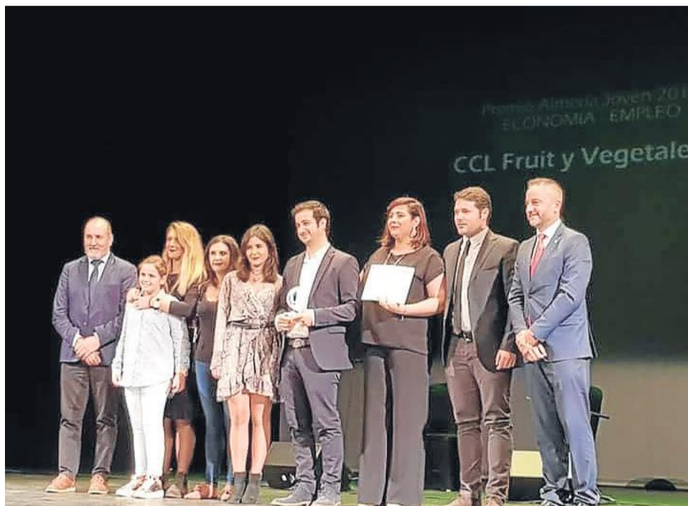
Un anterior premio, el de Almería Joven 2018, concedido por el IAJ,