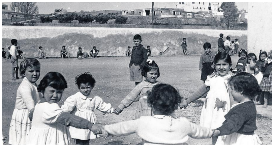
Niñas y niños jugando en el patio de las Escuelas Graduadas. 1954.

Vista aérea del Castillo del Marqués de los Vélez, donde se propuso ubicar las escuelas graduadas durante la República. Hacia 1969.