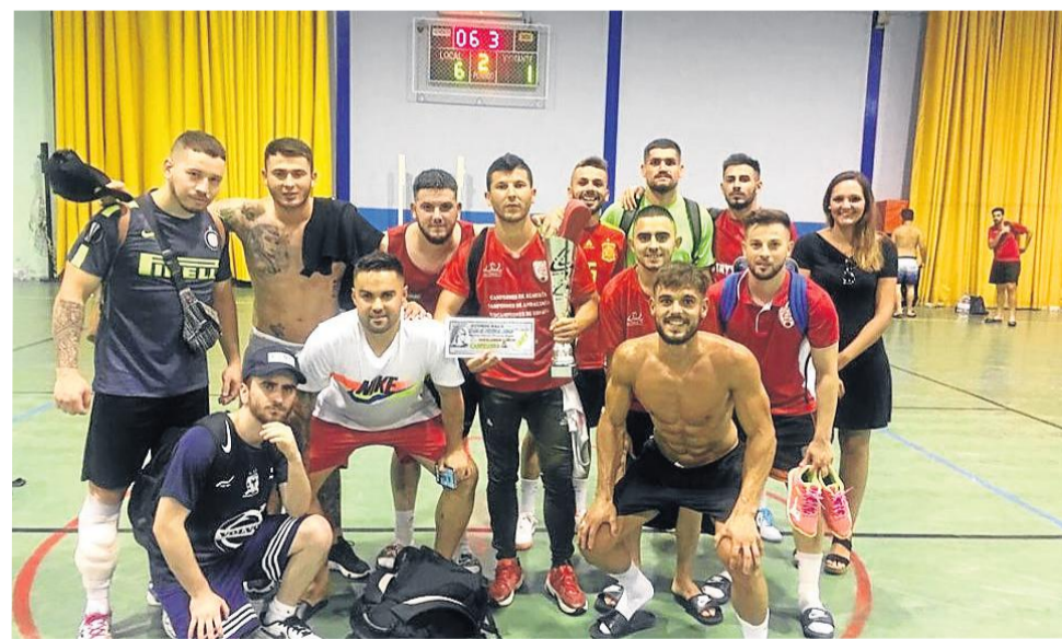
Los ganadores de la V edición del 24 horas de Fútbol Sala en Cuevas, el equipo 'Los Laikers'.

El Ayuntamiento de Cuevas del Almanzora, a través de la concejalía de Deportes, celebró con éxito la V edición de las 24 horas de Fútbol Sala, con 9 equipos participantes y más de 100 jugadores.