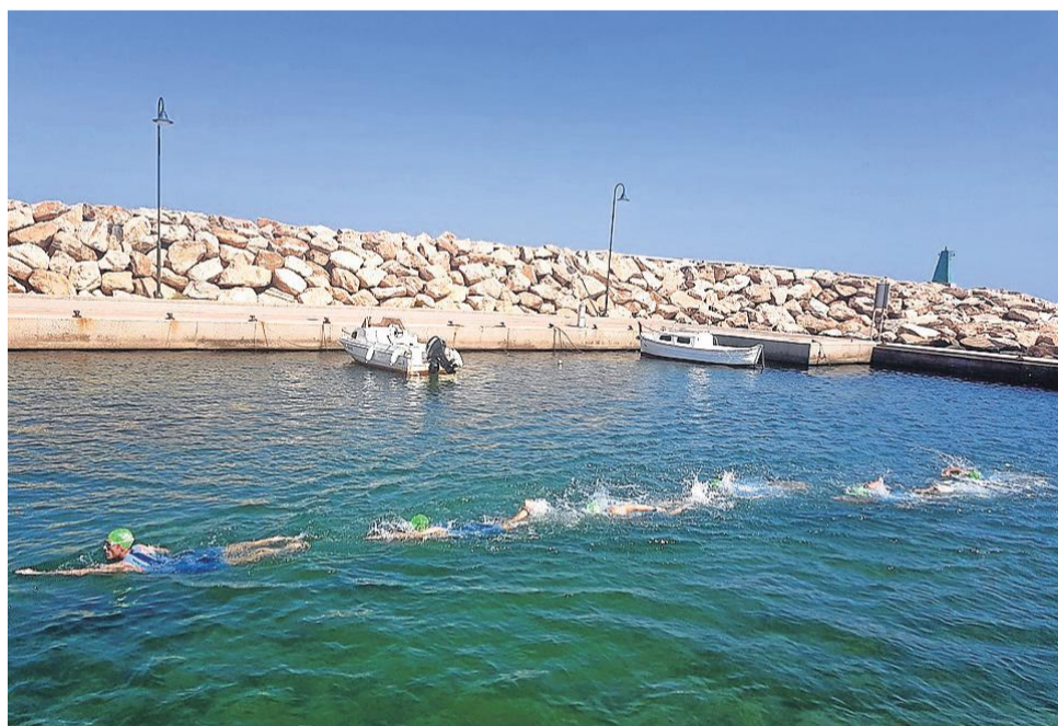
La prueba de natación en el Triatlón cuevano.