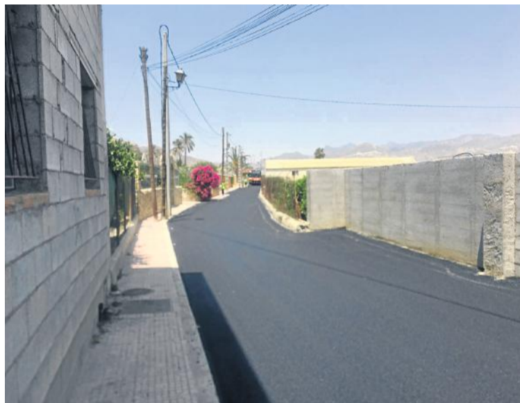
Camino de Calguérin.

obras muy necesarias que había solicitado el consistorio tras las demandas vecinales y que ya por fin son una realidad, gracias a la colaboración del Ayuntamiento cuevano y la Diputación