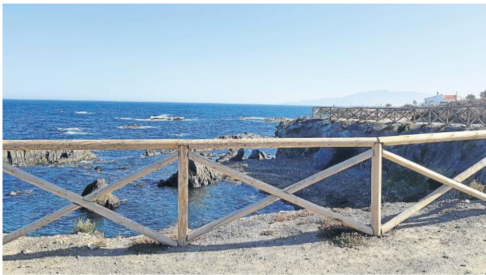
Mejoras en los accesos de las calas cuevanas.

Además, “se ha activado un operativo de seguridad compuesto por 10 socorristas, policía local y protección civil, que se encargarán de velar por la seguridad de todos en nuestras playas”, recordó el regidor.