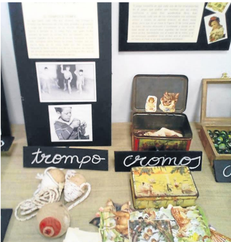
Algunos de los juegos de la época.