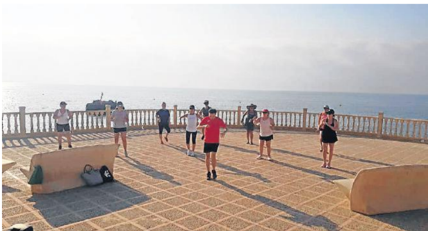
Zumba en la playa de Villaricos.

Escuelas de verano, animaciones, juegos de agua, actuaciones, cursos y un sinfín de propuestas para pequeños y grandes